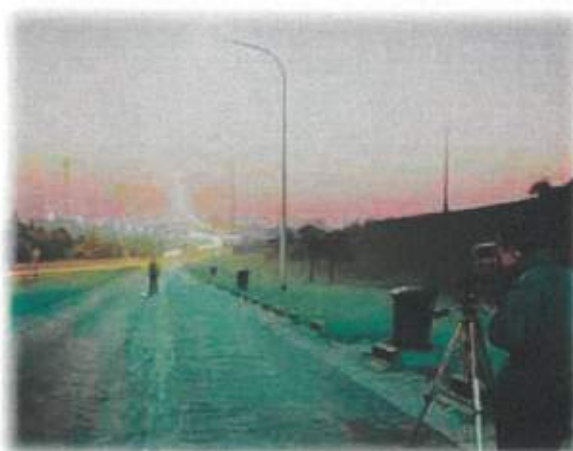
Figura 12 – Efectuare măsurători

În faza de operare reglementările principale sunt cele prevăzute în Regulamentul de funcționare a serviciului de iluminat al "Municipiului Carei". Aceste reglementări și indicatorii aferenți trebuie să fie în conformitate cu prevederile regulamentului cadru al A.N.R.S.C.