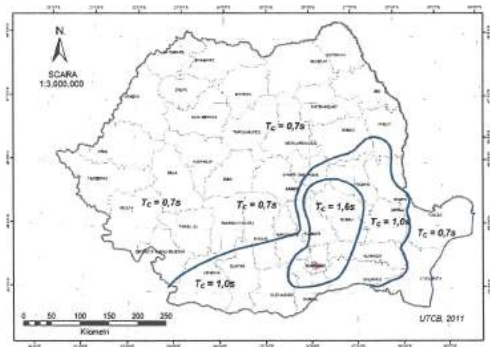
Fig. 5 Zonarea teritoriului României în termeni de perioada de control (colț), T_c a spectrului de răspuns